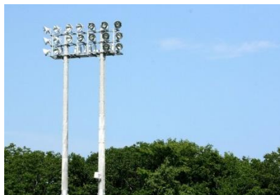
スポーツ施設の照明