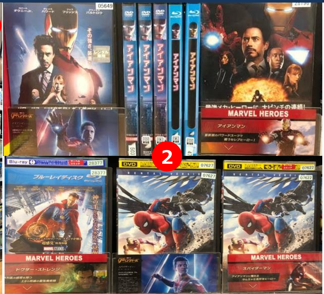
①元々は1スパン展開でしたが、2スパンに拡大！面陳POPもオリジナルで作成！