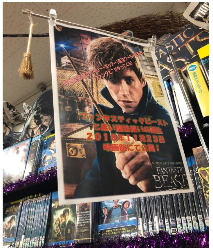
↑吊りPOPにて次回ファンタビの新作が劇場公開を紹介。