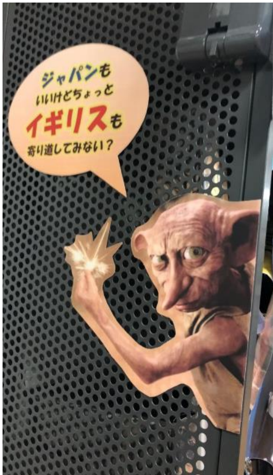
↑人気のキャラクタードビーでココにコーナーがあることをアピール。