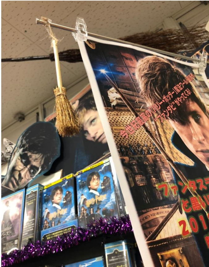
↑ここにも小さいホウキで小細工。